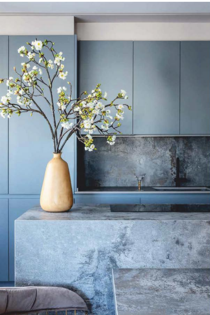
Detalle de la cocina. Los tonos grises y azulados aportan elegancia y frescor a un espacio de no grandes proporciones. Encimera de Dekton.

“El concepto de casa es un combinado de elementos ‘duros’ –cemento, hierro forjado, piedra o metal– con otros muy ‘soft’, tales como el papel pintado, el terciopelo...”