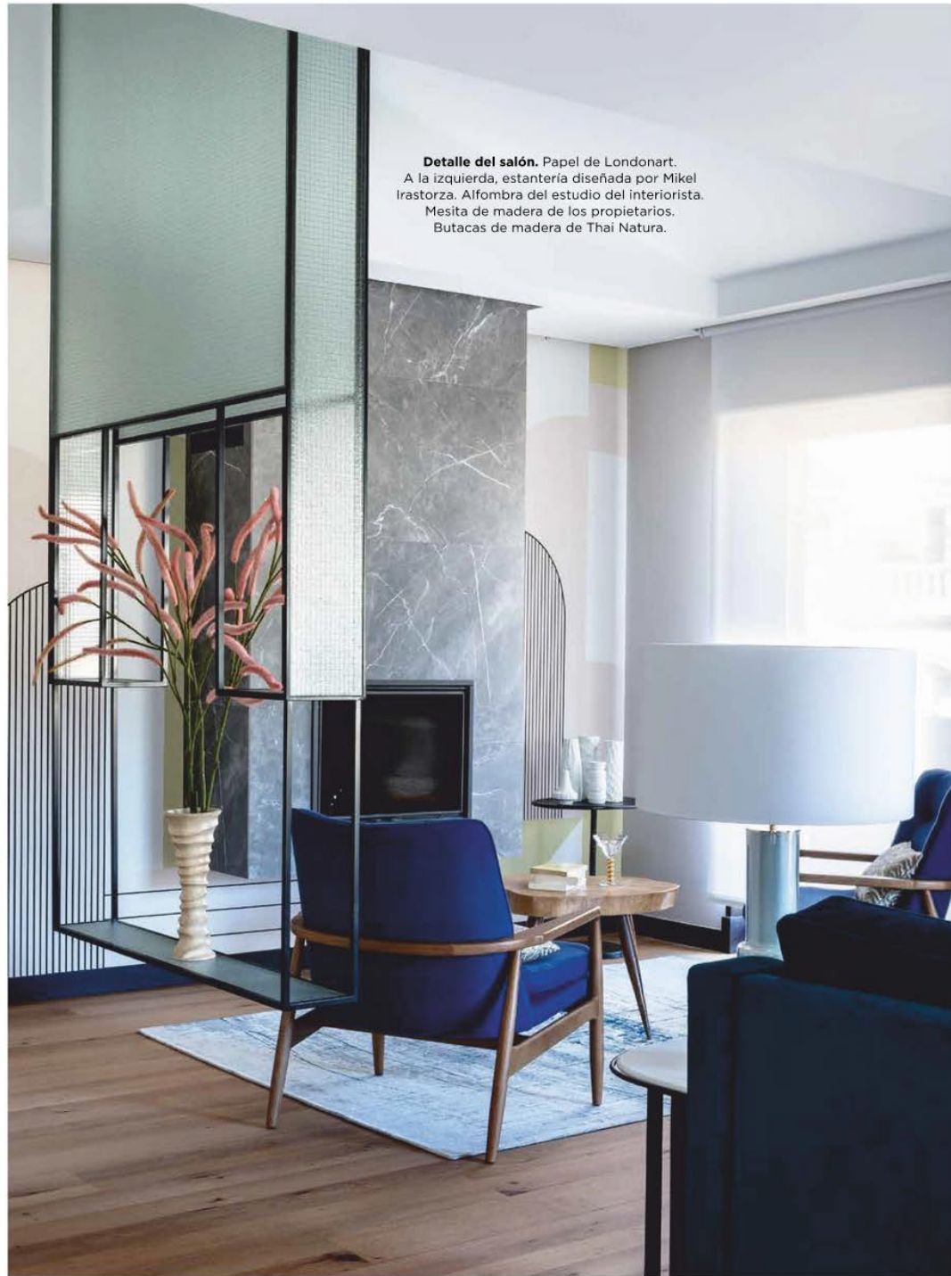
Detalle del salón. Papel de Londonart. A la izquierda, estantería diseñada por Mikel Irastorza. Alfombra del estudio del interiorista. Mesita de madera de los propietarios. Butacas de madera de Thai Natura.