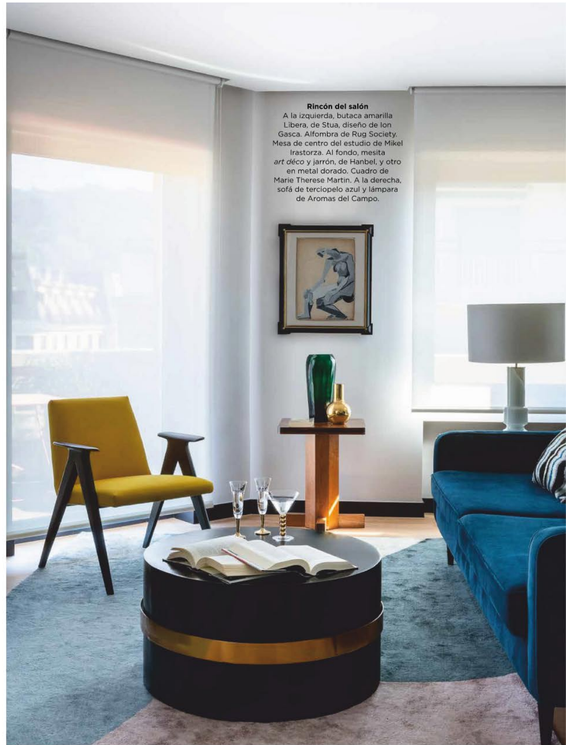
Rincón del salón A la izquierda, butaca amarilla Libera, de Stua, diseño de Ion Gasca. Alfombra de Rug Society. Mesa de centro del estudio de Mikel Irastorza. Al fondo, mesita art déco y jarrón, de Hanbel, y otro en metal dorado. Cuadro de Marie Therese Martin. A la derecha, sofá de terciopelo azul y lámpara de Aromas del Campo.