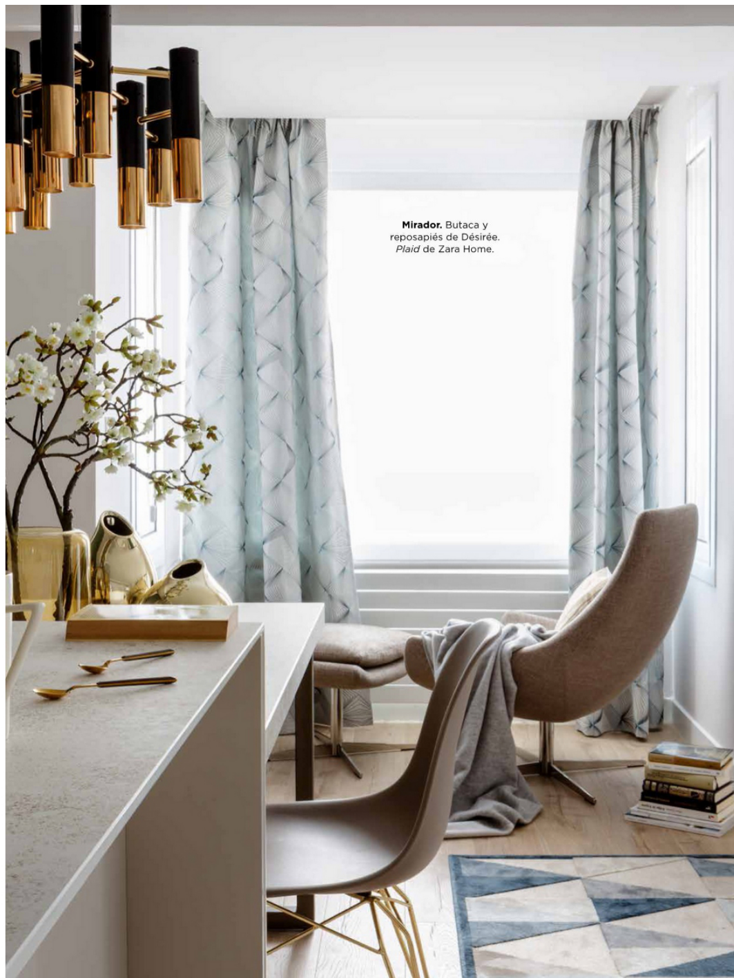
Mirador. Butaca y reposapiés de Désirée. Plaid de Zara Home.