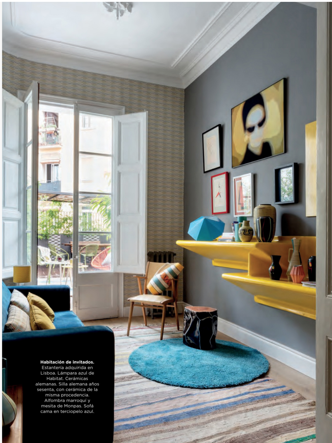
Habitación de invitados. Estantería adquirida en Lisboa. Lámpara azul de Habitat. Cerámicas alemanas. Silla alemana años sesenta, con cerámica de la misma procedencia. Alfombra marroquí y mesita de Monpas. Sofá cama en terciopelo azul.