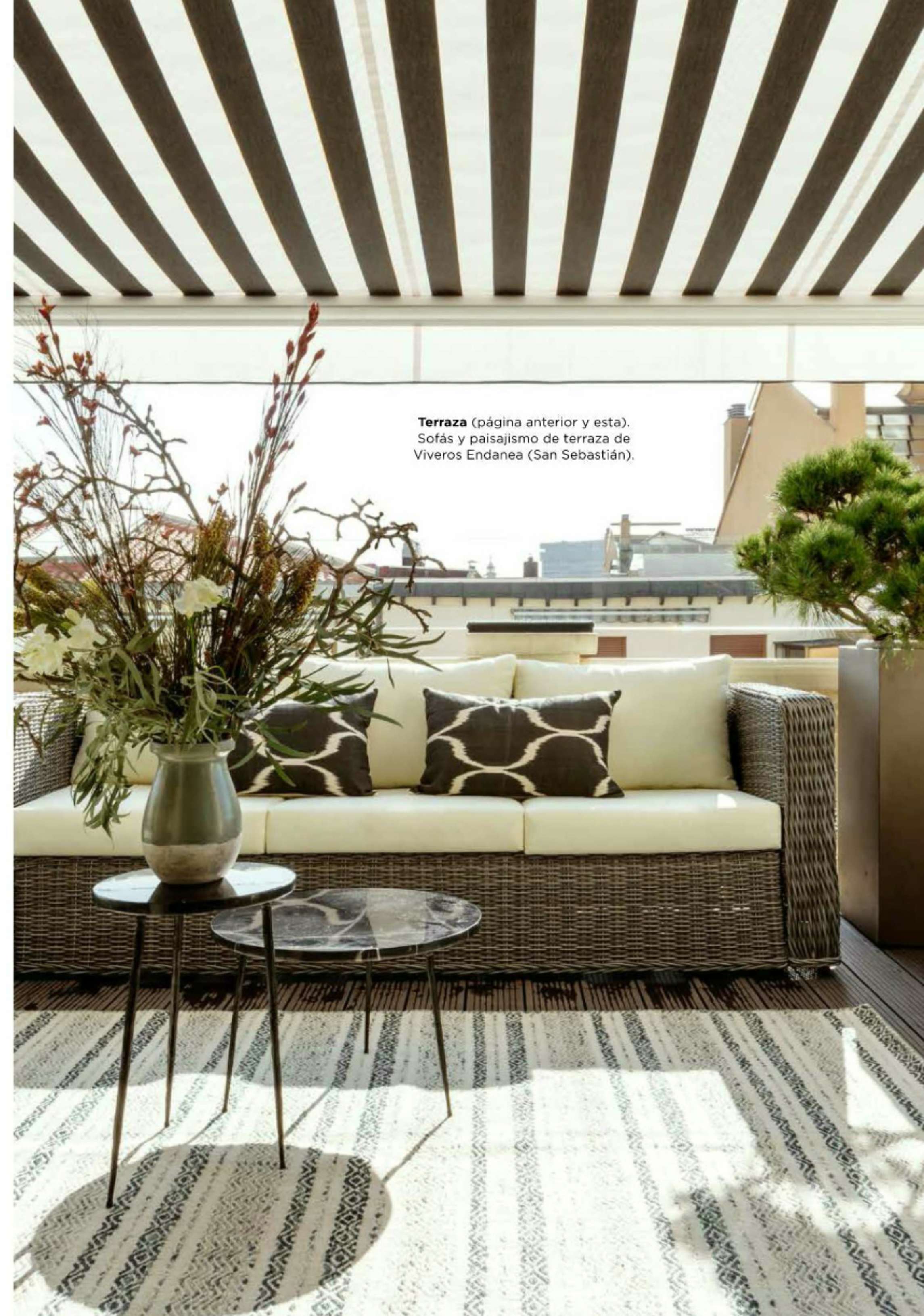
Terraza (página anterior y esta). Sofás y paisajismo de terraza de Viveros Endanea (San Sebastián).